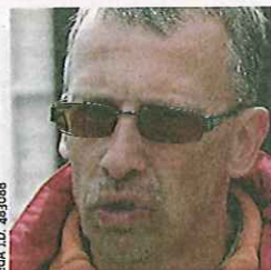
Éd. J.D. 48908

« Si une personne a le déclic pour l'aéromodélisme, je ne lui conseille pas de se précipiter au magasin pour acheter du maté-