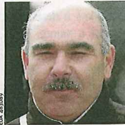
Éd. J.D. 48908

Une bonne vue est aussi un atout. « Un modèle réduit réagit exactement comme un planeur classique. La différence, c'est que le pilote ne ressent pas les mouve-